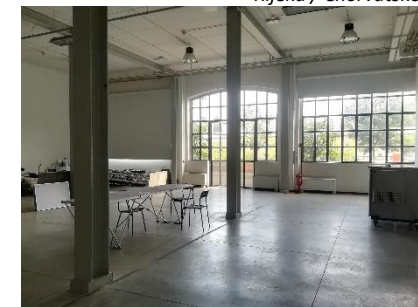
Milano / Itálie