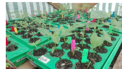
Norimberk / Německo