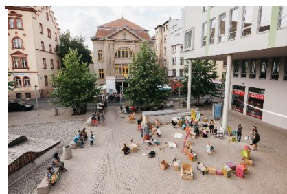
Ústí nad Labem / Česká republika

Varšava vybrala oblast historické čtvrti Praga-Północ (sever). Původně se jednalo o komplex čtyř budov postavených v letech 1910 – 1914. Zachována již je pouze jedna. V objektu v rámci pilotní akce vznikly finančně dostupné obchody a studia pro místní řemeslníky, designéry a umělce, co-workingové místo, konferenční a vzdělávací prostory a kulturní centrum pro místní komunitu a neziskové organizace.