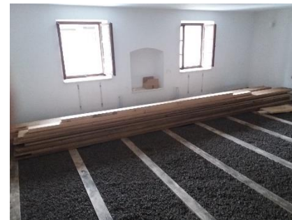
Ljubljana / Slovinsko