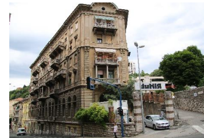
Rijeka / Chorvatsko