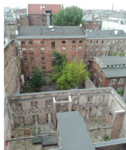
Varšava / Polsko