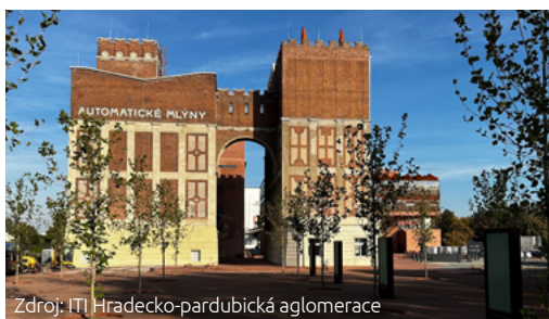
Zdroj: ITI Hradecko-pardubická aglomerace