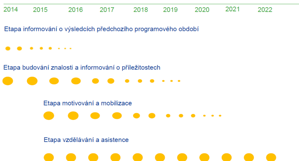
Schéma č. 2: Zahájení čerpání v novém období definuje pro rok 2017 etapy komunikace

Komunikace v roce 2017 zapadá z hlediska fází, vytyčených ve Společné komunikační strategii zejména do etapy „ Budování znalosti a informování o příležitostech programového období 2014–2020 “ a „ Motivování a mobilizace “ a zároveň do etapy „ Vzdělávání a asistence “. Vzhledem k možnosti využít projekty daného období pak i do etapy „ Informování o výsledcích předchozího programového období “ (fotografie, case studies).