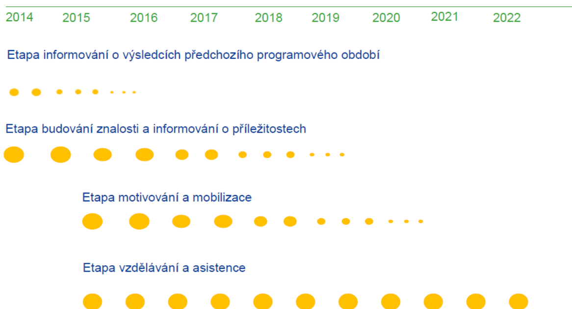
Schéma č. 2: Zahájení čerpání v novém období definuje pro rok 2016 etapy komunikace

Komunikace v roce 2016 zapadá z hlediska fází, vytyčených ve Společné komunikační strategii zejména do etapy „ Budování znalosti a informování o příležitostech programového období 2014–2020 “ a „ Motivování a mobilizace “ a zároveň do etapy „ Vzdělávání a asistence “. Vzhledem k ukončování čerpání v předchozím PO a díky možnosti využít projekty daného období pak i do etapy „ Informování o výsledcích předchozího programového období “.