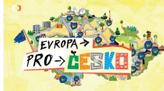
Znělka minipořadů z České televize

Kampaň na letišti Václava Havla na Terminálu 2, ze kterého směřují lety do Schengenského