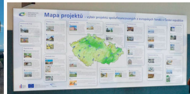
Mapa projektů na Terminálu 2 Letiště Václava Havla Praha

prostoru, představovala úspěšně realizované projekty podpořené z fondů EU v programovém období 2007–2013 pod heslem „Jeden příklad za všechny“. Na velkých reklamních plochách bylo využito motivu mapy ČR, do které byly zasazeny představované projekty. Cílem kampaně bylo zvýšit informovanost nejen mezi českými, ale i mezi zahraničními cestujícími, kteří využívají služeb největšího českého letiště. Tato kampaň získala mnoho pozitivních ohlasů.