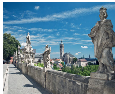
Vyfoť projekt – vítězné foto Ivana Ruska z Brna