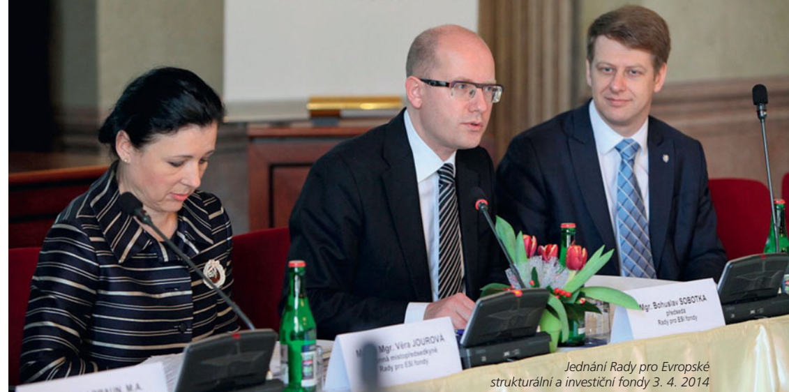
Jednání Rady pro Evropské strukturální a investiční fondy 3. 4. 2014

Rizika lze spatřovat v zajištění existence strategických dokumentů a jejich schválení, kvalitě, příp. velkém počtu pro daný segment. Průběžně jsou schvalovány strategické dokumenty, přičemž Evropská komise vyžaduje posouzení jejich obsahu, vazeb na návrhy jednotlivých programů a zejména reflexe požadavků vyplývajících z předběžných podmínek.