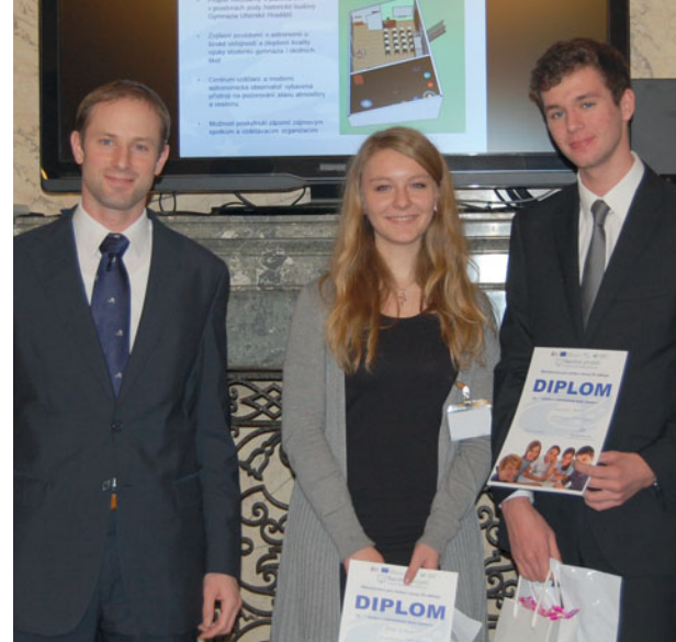
1. místo – tým studentů Gymnázia Vimperk

Na druhém místě se umístil tým studentů Gymnázia Benešov s návrhem rekonstrukce tamního autobusového nádraží. Jako třetí nejlepší projekt na celostátní úrovni porota ocenila návrh informační kampaně o možnostech zlepšení kvality ovzduší na Opavsku, který představil tým studentů Slezského gymnázia Opava. „Výběr nejlepšího projektu nebyl jednoduchý. Návrhy, které postoupily do celostátního kola, byly po všech stránkách detailně zpracované, realizovatelné a také dlouhodobě udržitelné. Studenti prokázali vynikající znalost dané problematiky a své návrhy konzultovali nejen s odborníky, ale také s předpokládanými