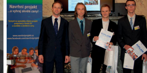
2. místo – tým studentů Gymnázia Benešov