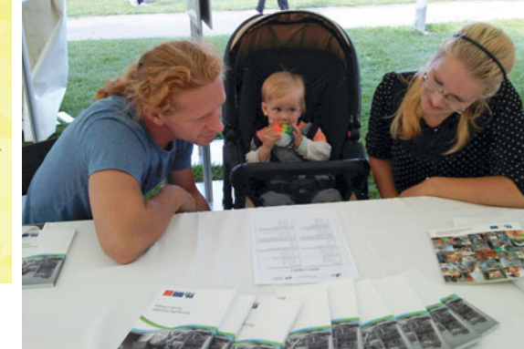
Ladronkafest2013 – luštění kvízů o EU