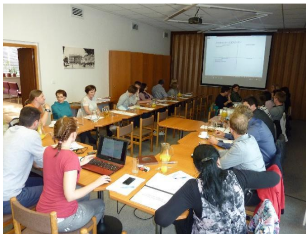
Obr. 1 Setkání aktérů působících ve vzdělávání (MěÚ Vizovice - květen 2016)