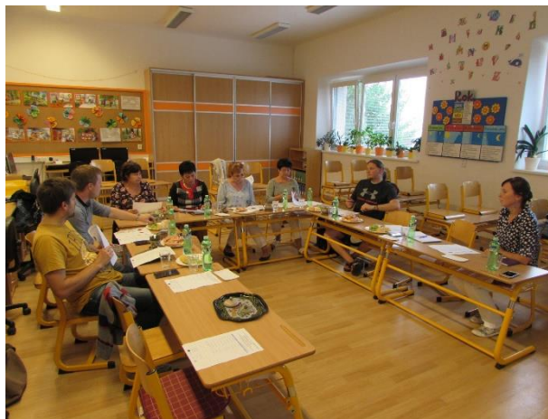
Obr. 3 Jednání pracovní skupiny ZŠ a MŠ (ZŠ a MŠ Veselá - září 2016)