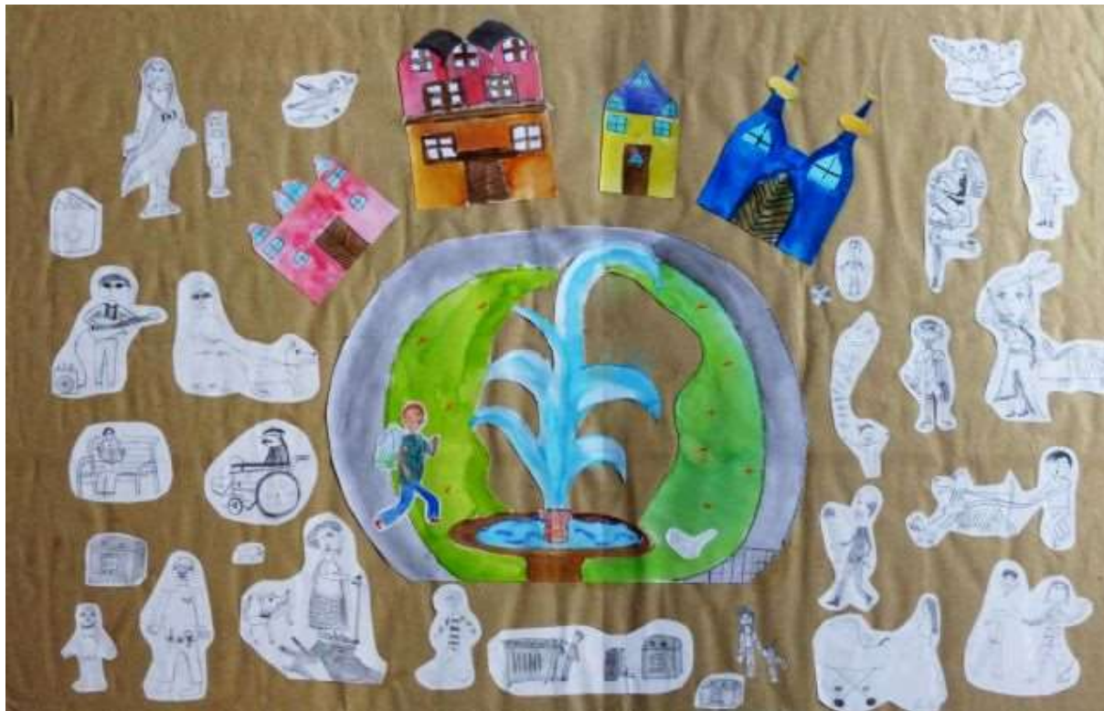
Obr. č. 1: Ilustrace k vizi