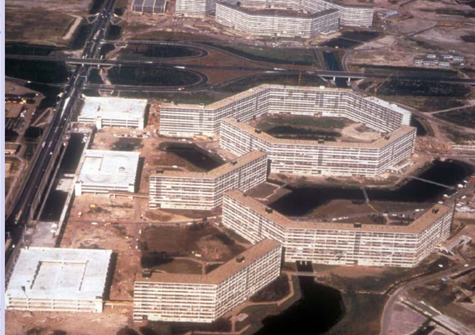
The Bijlmermeer under construction