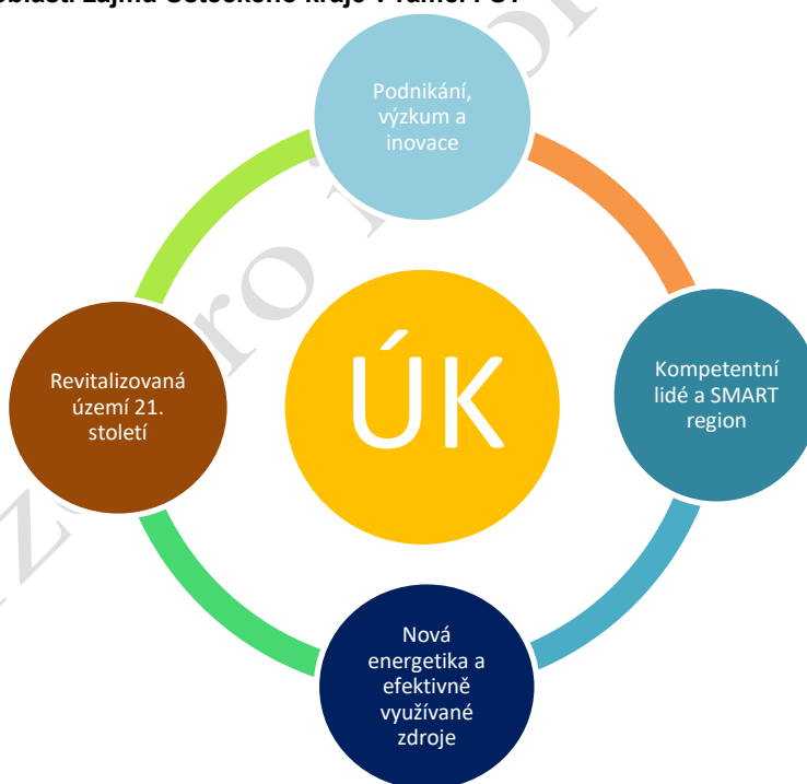
Obrázek 1 - tematické oblasti zájmu Ústeckého kraje v rámci FST