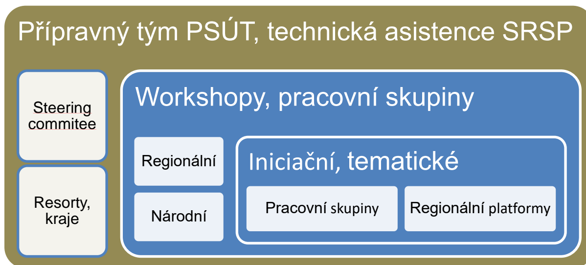
Obrázek 4 - schéma zapojení partnerů do přípravy PSÚT

Steering committee je sestaven ze zástupců EK, resortů a dotčených krajů.