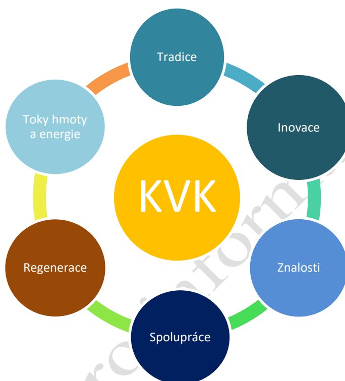
Obrázek 2 - tematické oblasti zájmu Karlovarského kraje v rámci FST