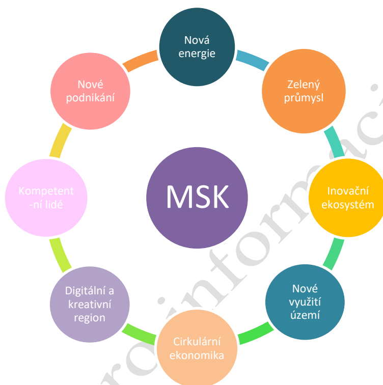
Obrázek 3 - tematické oblasti zájmu Moravskoslezského kraje v rámci FST