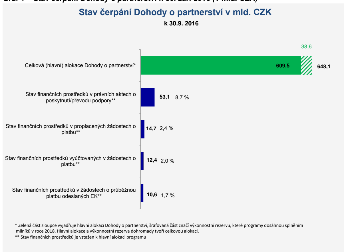
Graf 1 – Stav čerpání Dohody o partnerství k 30. září 2016 (v mld. CZK)