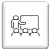
Vzdělávání a sociální inkluze