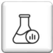
Výzkum a vývoj