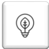
Čistá energie, energetické úspory