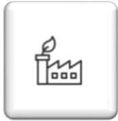
Malé a střední podniky